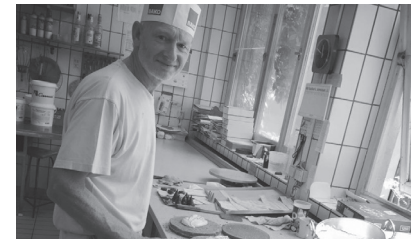
Der Konditormeister heute

Über die Pflege der alten Handwerks-tradition hinaus stellen wir uns aber auch den Anforderungen der modernen Zeit. Die Café-Confiserie Urbann soll Treffpunkt der Generationen sein. Ein Ort der Information und Kommunikation oder schlicht eine Oase der Entspannung und Ruhe in einer sich immer schneller wandelnden Zeit.