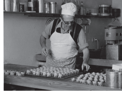
Der Konditormeister damals

von den Gästen hoch geschätzt und schon bald war die Café-Confiserie Urbann ein gern besuchter Treffpunkt in Wels. Im Jahre 1925 wurde schließlich zum bestehenden Stammhaus ein weiterer Standort in der Bahnhofstraße eröffnet.