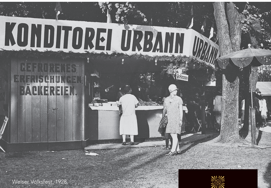
Welscher Volksfest, 1928